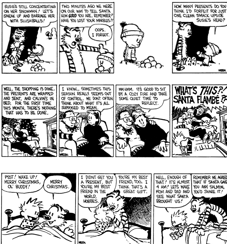
Calvin and Hobbes Complete Collection - 7 - Attack of the Deranged Mutant Killer Monster Snow Goons