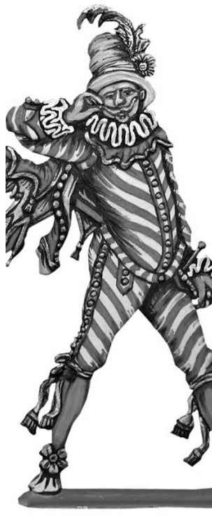
Dottore, Pantalone, Arlecchino