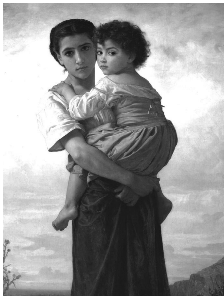
William-Adolphe Bouguereau: Fiatal cigányok (1879)

Pszichológiai tény, hogy senki nem szereti, ha valami olyan átformálására kényszerítik, ami berögzült. Berögződéseink olyan stabillá váltak bennünk, mint egy-egy szervünk, amelyeket hát... eléggé fájdalmas átformálni. A sztereotípiák leküzdése ellen pedig még kevesebbet tudunk tenni, amelyek részben evolúciósan alakultak ki bennünk. Idegenkedünk az ismeretlen ételtől, embertől, amely jelenséget szakszóval neofóbiának nevezünk. Az ördögöt automatikusan feketének, az angyalt pedig fehérnek képzeljük el... vicces séma, de nagyon is életszerű a sötét cigá-