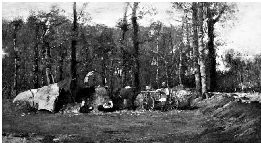
Munkácsy Mihály: Cigánytábor

Fontos leszögezni, hogy az ember az egyetlen faj, akiknél egyetlen gén különböző variánsai fordulnak elő egyes emberekben. A cigányság közös származása – teljesen mindegy, hogy azon belül melyik csoport – genetikailag kimutatható, viszont a gének szintjén arra még nem lehet választ adni, hogy a gén-, illetve génszabályozási variánsok hozzájárulhattak-e a többségi társadalomba való beilleszkedési zavaraihoz. Ami biztos, hogy a körülményekhez való alkalmazkodás okoz tovább örökíthető módosulásokat, illetve – viszonylag zárt, nomád csoportról lévén szó – erősen domináns a kulturális gének zárt körben való mozgása, és így intenzív manifestációja. A nomád, hányattatott életmód magával vonja a túlélőképességre